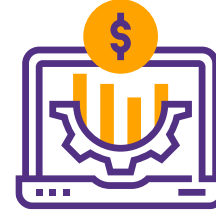
Gestão de Receita