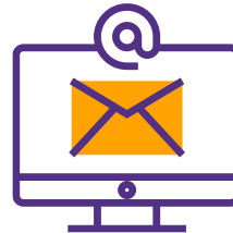
Motor de Reservas Diretas